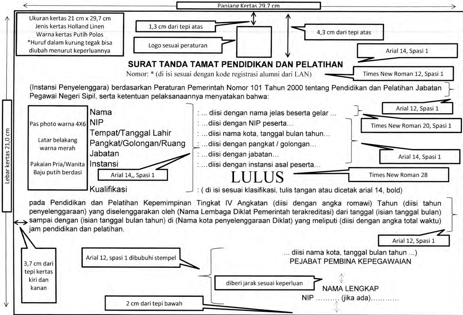
Formulir 11 : Format STTPP Diklat Kepemimpinan Tingkat IV (halaman depan)